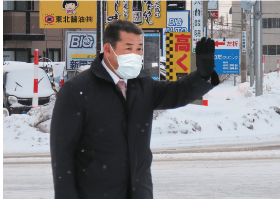
秋田市内にて辻立ち