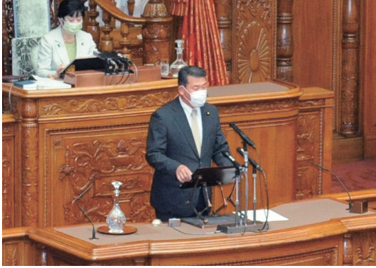
参議院本会議にて地方創生及び消費者問題に関する特別委員会委員長として委員長報告