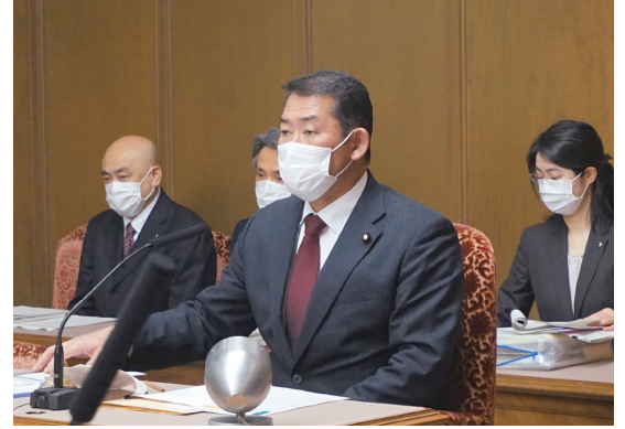
議院運営委員会庶務関係小委員長として小委員会を運営