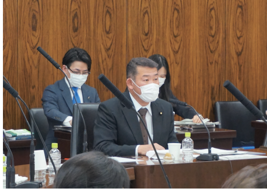
参議院地方創生及び消費者問題に関する特別委員会委員長として委員会を運営