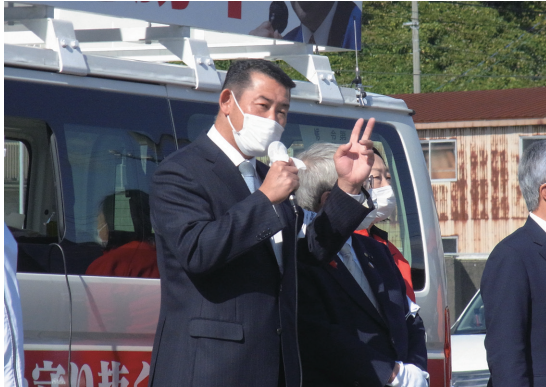
衆議院議員総選挙での応援演説