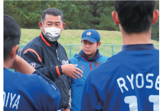
少年野球教室にて指導