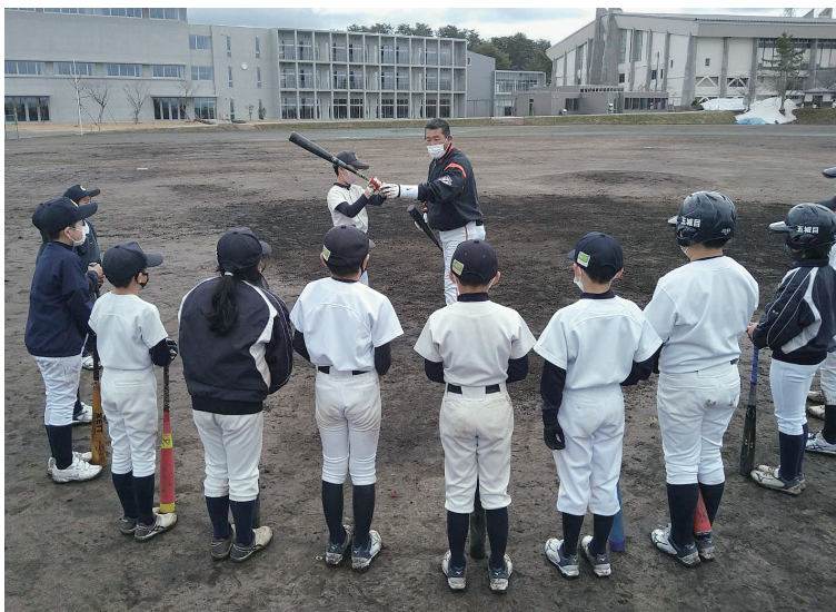
少年野球教室にて指導