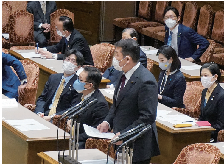
議院運営委員会にて質疑