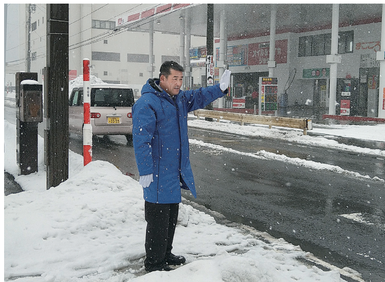
秋田県内にて辻立ち